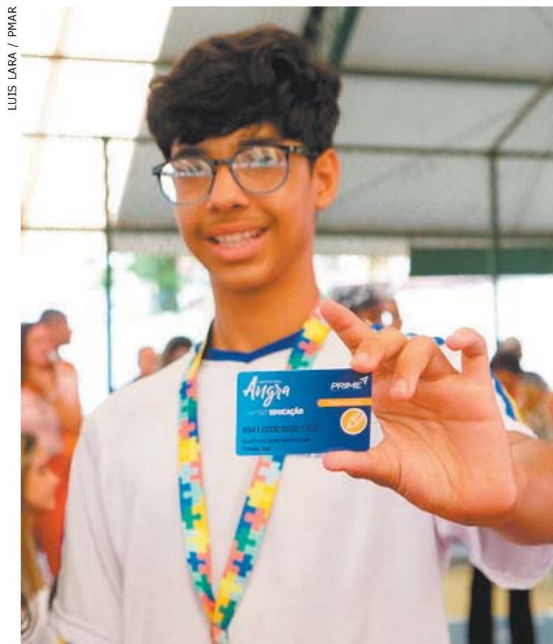
ESTUDANTES estão recebendo os cartões nas escolas

Para compra de material de apoio ao trabalho pedagógico (Cartão Professor), a secretaria de Educação iniciou o repasse em março, de R$ 1 mil aos docentes I e II, pedagogos, diretores e auxiliares de direção em efetivo exercício e no desempenho das atribuições dos seus respectivos cargos e funções. ■