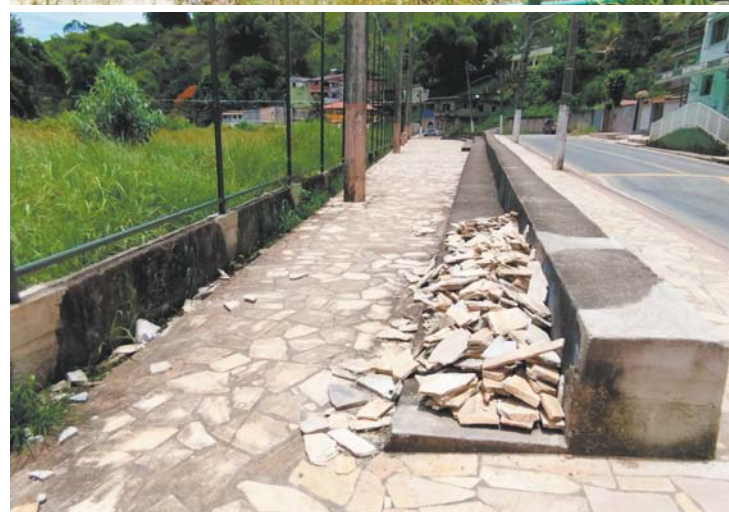
LOCAL não tem nenhuma aparência de melhorias