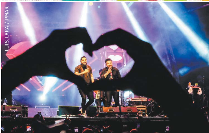
LUIS LARA / PMAR