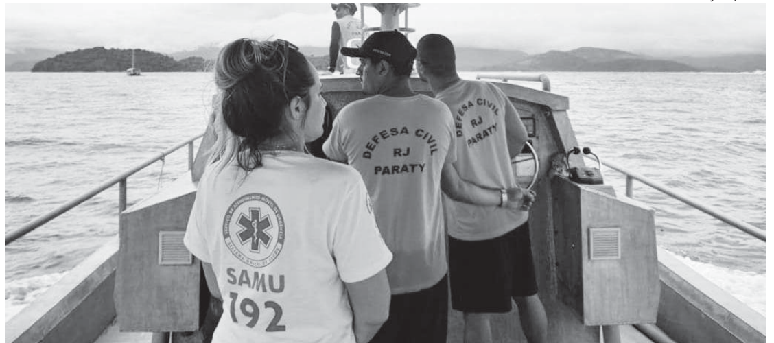
AGENTES de saúde da prefeitura acompanham movimentação de escunas e barcos

Desde o dia 26 de dezembro foram realizados 20 atendimentos. A equipe é composta por enfermeira e técnico de enfermagem, a postos