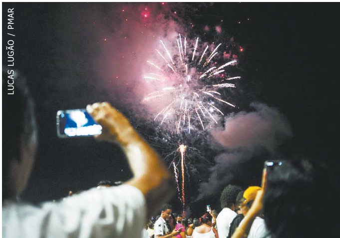
LUCAS LUGÃO / PMAR