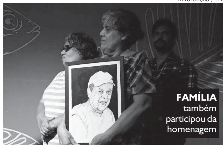
FAMÍLIA também participou da homenagem

— Foi um momento de muita festa, emoção e memórias, com a presença de sua viúva, dona Glorinha, suas filhas e netos. A quadra da Chácara da Saudade estava