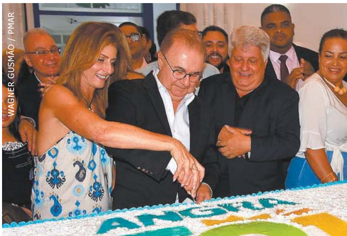
WAGNER GUSMÃO / PMAR