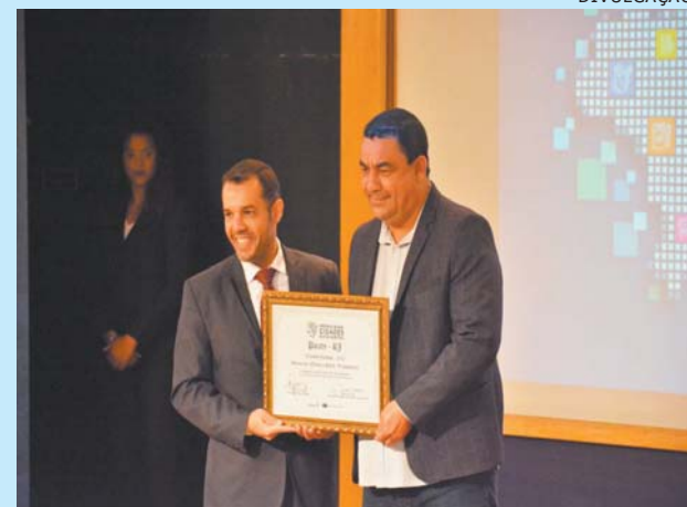
PREFEITO recebe a homenagem da Band

A atual gestão da prefeitura de Paraty levou para casa na última semana mais um reconhecimento de eficiência e bons resultados, atestando a qualidade dos serviços públicos oferecidos pela cidade. Desta vez o reconhecimento veio por meio do prêmio 'Band Cidades Excelentes 2022', organizado e concedido pelo Grupo Bandeirantes de Comunicação, em parceria com o Instituto Aquila em reconhecimento à prática da boa gestão pública para melhorar a realidade dos 5.570 municípios brasileiros.