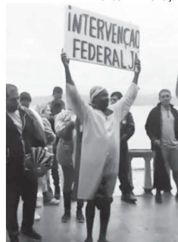
MANIFESTANTES pediram intervenção e golpe militar no país

O futuro ex-presidente Bolsonaro reconheceu a legitimidade das reclamações e do inconformismo de seus apoiadores, porém disse que estas manifestações não podem im-