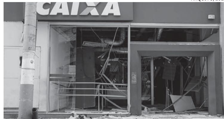
RIO teve seis ataques a agências bancárias só este ano

Nas redes sociais havia informação de que até 8 homens haviam sido mortos nas ações da Polícia, porém, nem a Polícia Civil nem o Instituto Médico Legal (IML) confirmaram